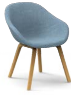
PEQUEÑO / Petita / Petit / Small / Klein