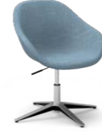
PEQUEÑO / Petita / Petit / Small / Klein