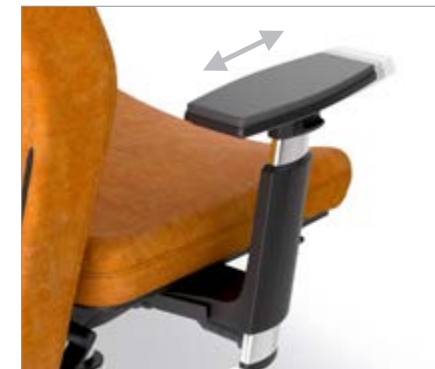
REGULABLE EN PROFUNDIDAD / REGULABLE EN PROFUNDITAT / RÉGLABLES EN PROFONDEUR / PAD DISPLACEMENT / TIEFENVERSTELLBAR