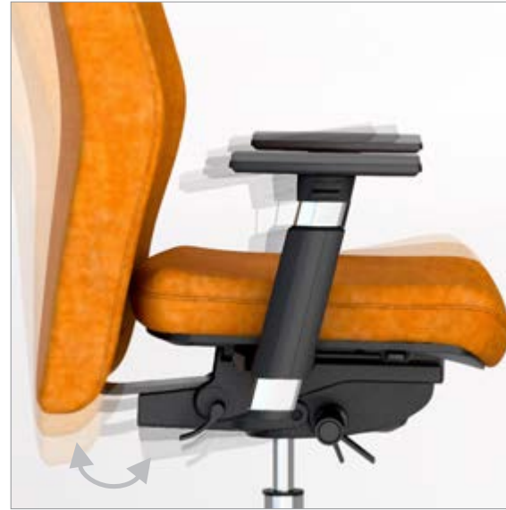
MECANISMO SINCRÓ / MECANISME SINCRÓ / MÉCANISME SYNCHRONE / SYNCHRO MECHANISM / SYNCHRONMECHANIK