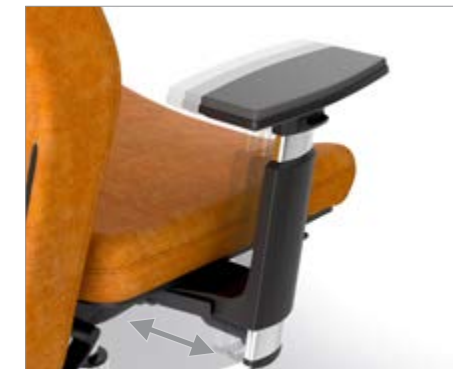
REGULABLE EN ANCHURA / REGULABLE EN AMPLADA / RÉGLABLES EN LARGEUR / WIDTH ADJUSTABLE / BREITENVERSTELLBAR