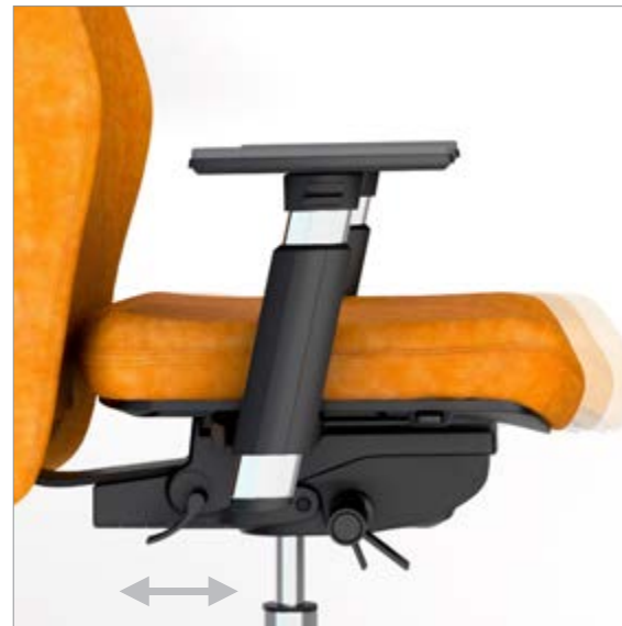
MECANISMO TRASLO / MECANISME TRASLO / TRANSLATION D'ASSISE / SEAT DEPTH ADJUSTMENT / SITZTIEFENVERSTELLUNG