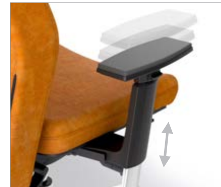
REGULABLE EN ALTURA / REGULABLE EN ALÇADA / RÉGLABLES EN HAUTEUR / HEIGHT ADJUSTABLE / HÖHENVERSTELLBAR