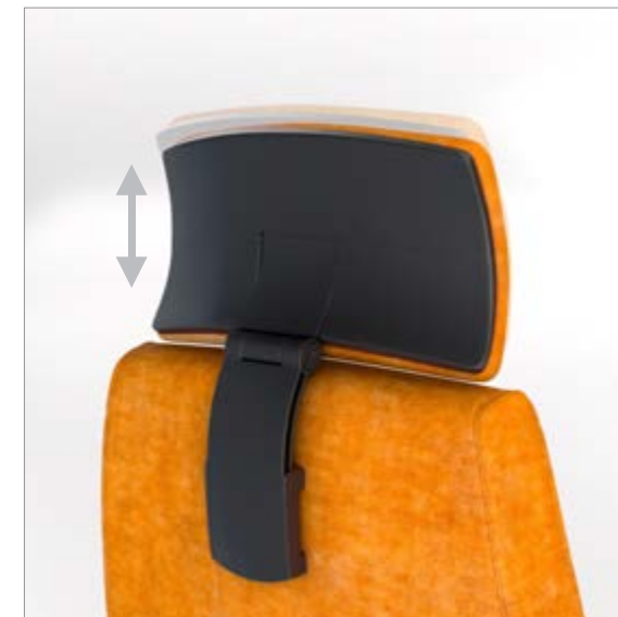
CABEZAL REGULABLE EN PROFUNDIDAD Y ALTURA CAPÇAL AJUSTABLE EN PROFUNDITAT I ALÇADA / TÊTIÈRE RÉGLABLE EN HAUTEUR ET PROFONDEUR / DEPTH AND HEIGHT ADJUSTABLE HEADREST / HÖHEN-UND TIEFENVERSTELTBARE KOPFSTÜTZE