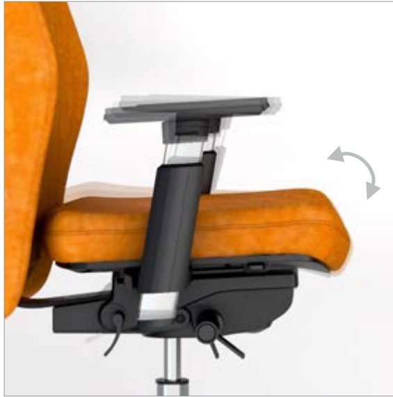
INCLINACIÓN ASIENTO / INCLINACIÓ SEIENT / INCLINAISON DE L'ASSISE / SEAT INCLINATION / SITZNEIGUNG

/ MOVIMENTS / RÉGLAGES / FEATURES / FUNKTIONEN