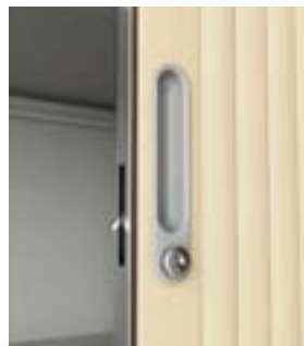
Pany magnètic amb pestanya

Pany substituïble en cas de pèrdua o ruptura amb la possibilitat de panys mestres o claus iguals.