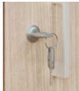
Parella de claus