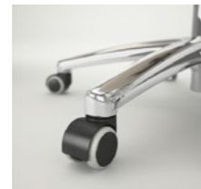
Ruedas dobles Ø 50 mm Rodes dobles Ø 50 mm / Roulettes doubles Ø 50 mm / Double wheels Ø 50 mm / Doppelaufrollen Ø 50 mm.