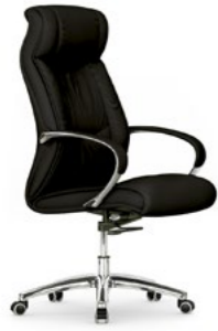
Silla de dirección. Cadira de direcció / Siège de direction / Executive chair / Chfessessel.