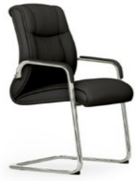
Balancín. Confident / Luge / Cantilever / Freischwinger.