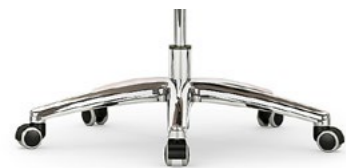
Aluminio pulido Alumini polit / Aluminium poli / Polished aluminium / Aluminium poliert.