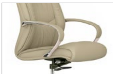
Brazos tapizados. Braços entapissats / Accoudoirs tapissés / Upholstered armrest / Gepolsterter Armauflage