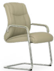
Cromada. Cromada / Chromée / Chrome / Verchromt.