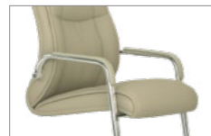
Brazos tapizados. Braços entapissats / Accoudoirs tapissés / Upholstered armrest / Gepolsterter Armauflage