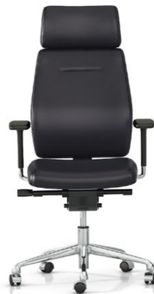
Cabezal fijo y respaldo fijo. Capçal i respallier fix / Tête et dossier fixe / Fixed headrest and backrest / Feste Kopfstütze und Rückenlehne.