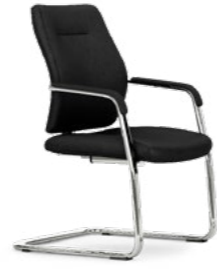
Balancín. Confident / Luge / Cantilever / Freischwinger.