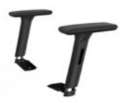
Brazos regulables 3D Braços regulables 3D / Accoudoirs régulables 3D / 3D adjustable arms / 3D Höhenverstellbare Armlehnen