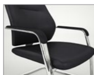
Brazos tapizados. Braços entapissats / Accoudoirs tapissés / Upholstered armrest / Gepolsterter Armauflage