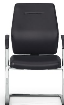
Respaldo fijo. Respallier fix / Dossier fixe / Fixed backrest / Feste Rückenlehne.