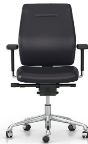
Respaldo fijo. Respallier fix / Dossier fixe / Fixed backrest / Feste Rückenlehne.