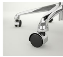
Ruedas dobles Ø 50 mm Rodes dobles Ø 50 mm / Roulettes doubles Ø 50 mm / Double wheels Ø 50 mm / Doppelaufrollen Ø 50 mm.