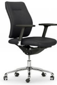
Respaldo medio. Respatller mitjà / Dossier moyen / Medium backrest / Mittlere Rückenlehne.