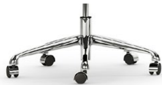
Aluminio pulido Alumini polit / Aluminium poli / Aluminium base / Aluminium poliert.