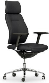
Silla de dirección. Cadira de direcció / Siège de direction / Executive chair / Chefessel.